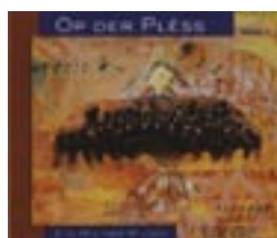
"Op der Plëss vol.2" prix: 15 €