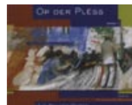
"Op der Plëss vol.1" prix: 15 €