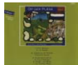
"Op der Plëss vol. 3" prix: 15 €