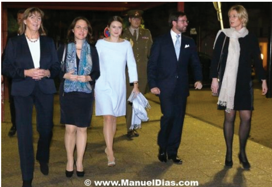
Die Schirmherren des Konzerts: Erbgroßherzog Guillaume mit seiner charmanten Gattin Stéphanie, Corinne Cahen, Ministerin für Familie und Integration, Francine Closener, Staatssekretärin, sowie Lydie Polfer, Bürgermeisterin der Stadt Luxemburg.

und Integrationsministerium unterstehende Einrichtung gibt sie wiederum in Zusammenarbeit mit dem Ministerium für nationale Erziehung, Kindheit und Jugend an die Kinder von Antragstellern auf internationalen Schutz und von Flüchtlingen weiter, die in Auffangklassen untergebracht sind und Musikunterricht erhalten.