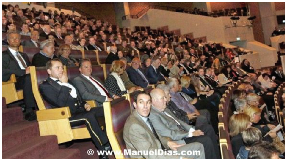
Vollbesetzte Ränge zeugen vom Großen Interesse am Benefizkonzert.