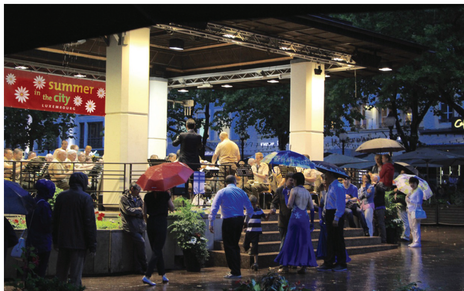
Für das Publikum fiel der diesjährige „Wiener Owender“ nach Blitz und Donner wortwörtlich ins Wasser.

Trotz aller Widerwärtigkeiten der Natur war es letztlich doch ein geselliger Abend, für dessen Neuauflage im nächsten Jahr man sich allerdings Sommerwetter erhofft. (j-lo)